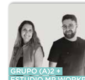
GRUPO (A)2 + ESTUDIO MP WORKPLACES Arqs. Josefina Tognola y Nicolás Illanes